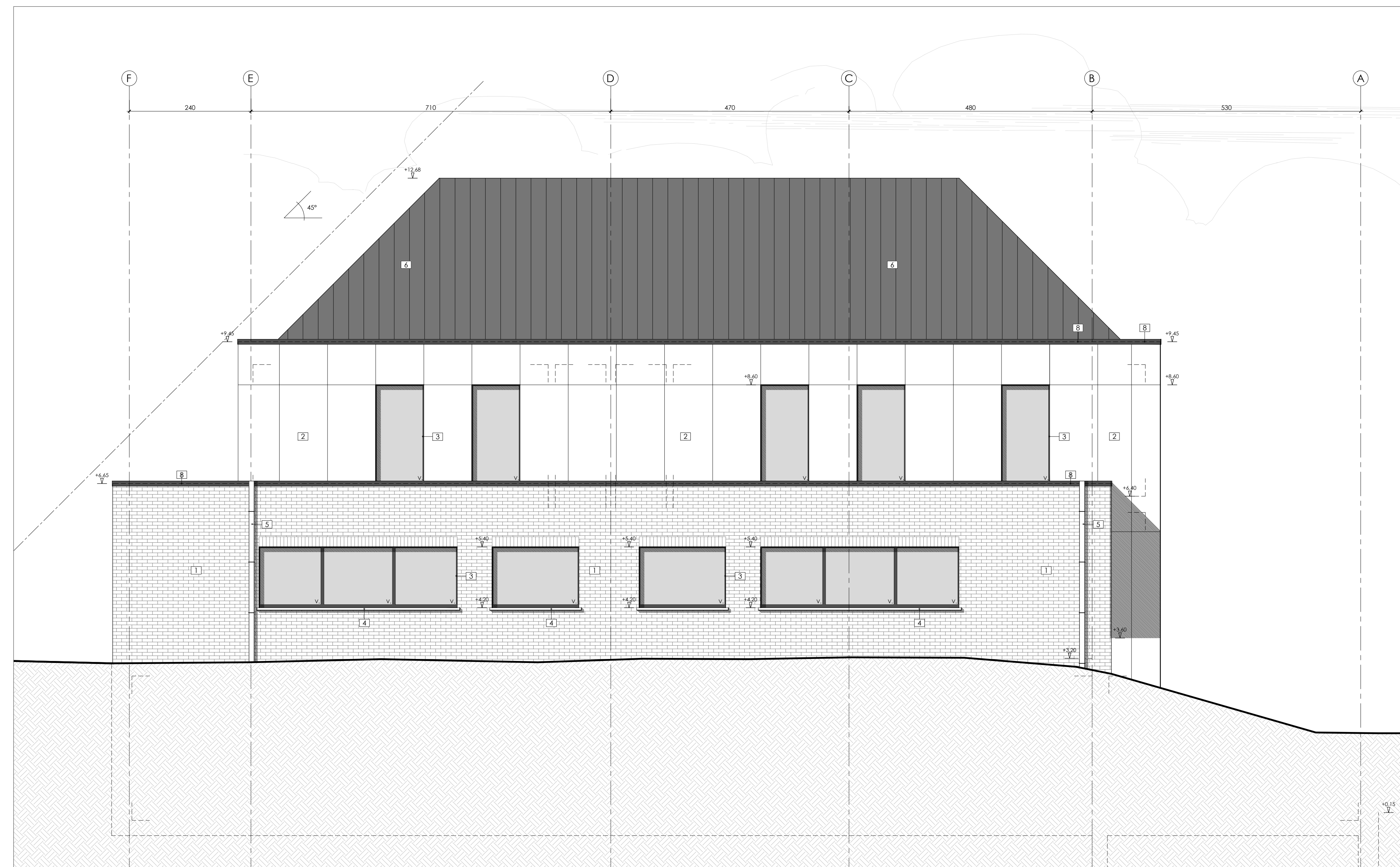
Achtergevel - 1/50