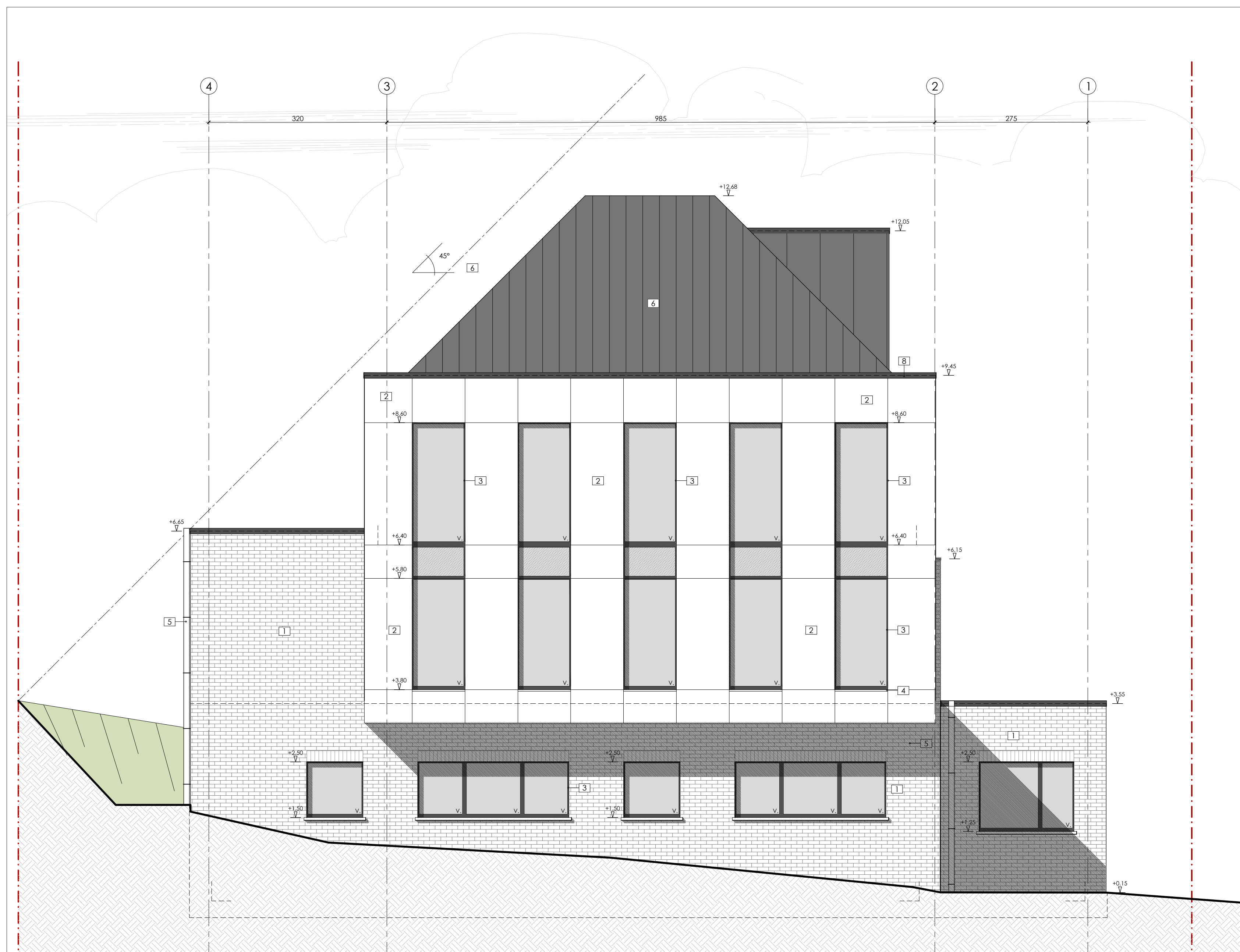
Zijgevel links - 1/50